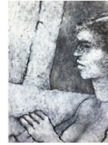
"SIN TITULO" IRENE DE LA TORRE