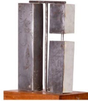
"CONSTRUCCIONES" ELVIRA DE LA TORRE