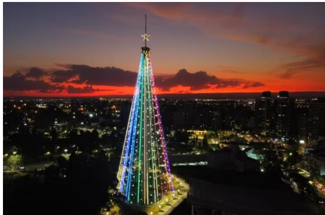
Árbol de Navidad iluminado en Córdoba, Argentina

EN ARGENTINA SE ACOSTUMBRA CELEBRAR LA NAVIDAD EN FAMILIA Y ES UN DÍA FESTIVO IMPORTANTE QUE SE COMPLEMENTA CON EL AÑO NUEVO.