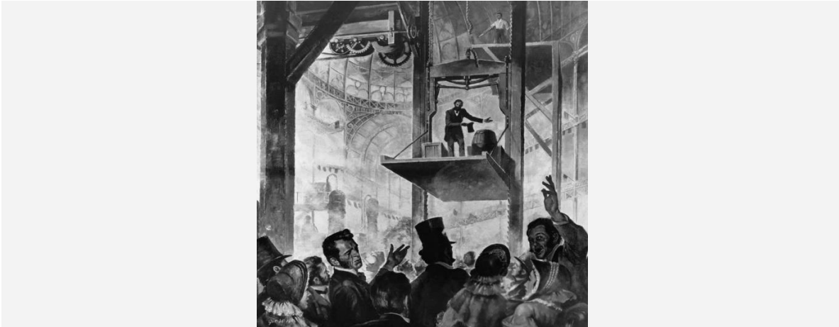
Elisha Otis enseñando el sistema de seguridad de sus ascensores, en la Feria de Nueva York del 1854.

De todas formas, la persona que resolvió el problema de la inseguridad en los ascensores, haciendo posible la construcción de edificios altos, fue Elisha Otis : el inventor del ascensor tal y como lo conocemos hoy en día. En 1852 , Otis desarrolló un diseño de elevadores con un sistema novedoso de seguridad: una especie de freno que, en el caso de rotura de cables, un pequeño marco de madera en la parte superior del ascensor saltaría, golpeando las paredes del hueco y deteniendo así el ascensor en su recorrido. Dicho invento fue presentado en la feria de Nueva York en el año 1854 .