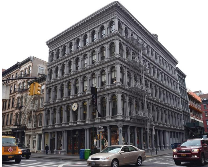
Edificio situado en Avenida Broadway 488 de Nueva York, en el que se instaló el primer ascensor en una comunidad de vecinos

El 23 de marzo es el DIA MUNDIAL DEL ASCENSOR y conmemora la inauguración de ese edificio un 23 de marzo de 1874.