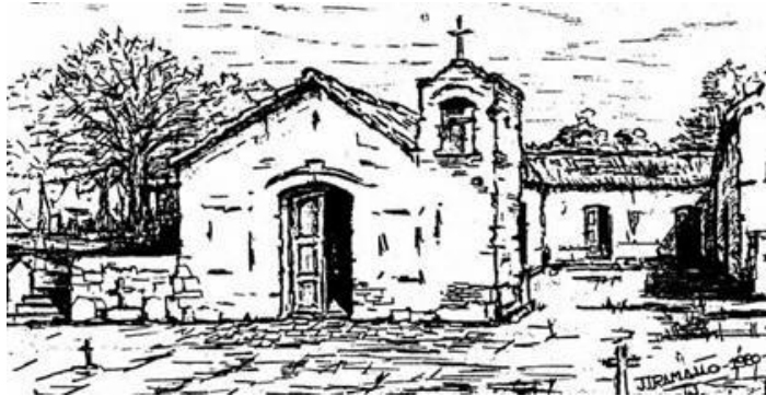
Primitiva Parroquia Nuestra Señora del Rosario del Valle de Tulumba - Dibujo realizado a lápiz por J. J. Ramallo, documentado en base a testimonios de personas que conocieron la capilla. Tomado de "Tulumba" - Calvimonte, L.Q.