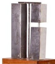
"CONSTRUCCIONES" ELVIRA DE LA TORRE